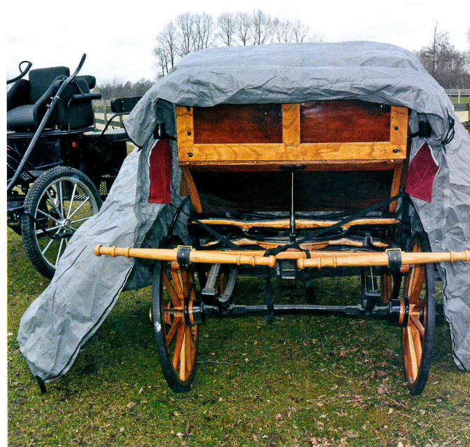
Die Schutzhaube lässt sich mit zwei Besen (linkes Bild) ganz einfach über größere Fahrzeuge stülpen. Zwei Gurtbänder mit Schlaufe unterstützen beim Ziehen. Außerdem kann mit ihnen die Haube am Fahrzeug fixiert werden (rechtes Bild).